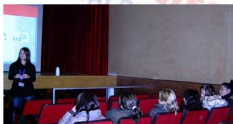
Diversos moments durant les xarrades que es van impartir al matí i la vesprada, del passat 1 de desembre.