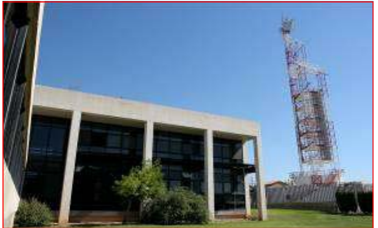
A la torre de comunicacions del CCE el personal de bombers va realitzar diferents pràctiques.