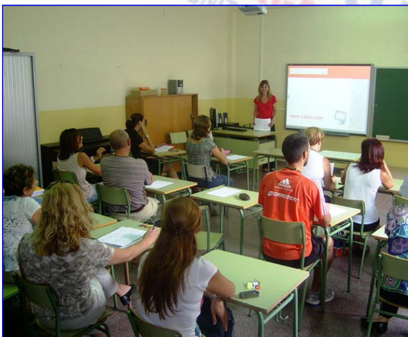
Los docentes durante un momento de la Charla de "1:1:2 Comunitat Valenciana"

El día 17 de septiembre, todo el personal docente del Colegio Villar Palasí (situado en la población de Quart de Poblet ) asistió a una de las muchas charlas divulgativas de " 1·1·2 Comunitat Valenciana ". La mayoría de los asistentes conocían la existencia de 1:1:2 e, incluso, alguno de ellos había tenido la necesidad de utilizarlo en alguna ocasión. Los profesores realizaron multitud de preguntas sobre: la Sala de Atención de Llamadas, tipología de las llamadas que se atienden, preguntas que se realizan según el tipo de incidente o el tratamiento que se les da a las llamadas tipificadas como "Llamada Falsa Broma".