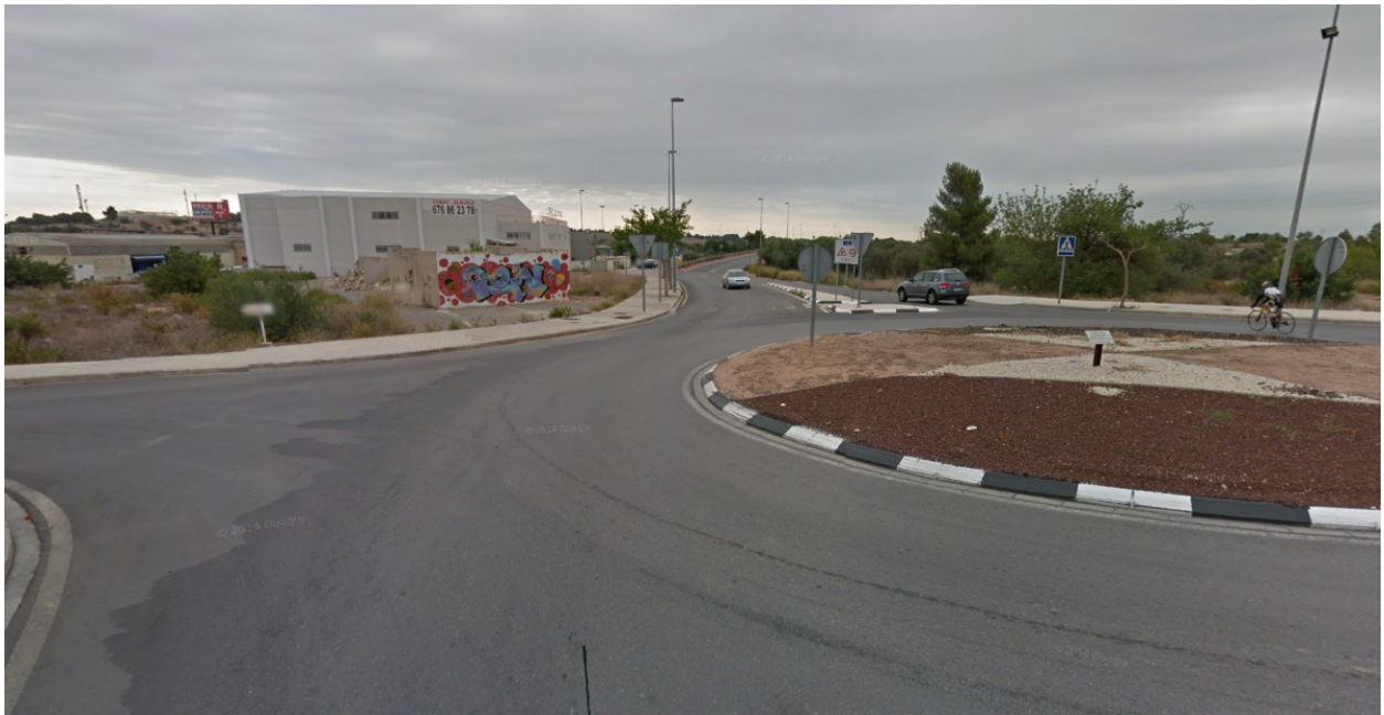
Punto de evacuación 1