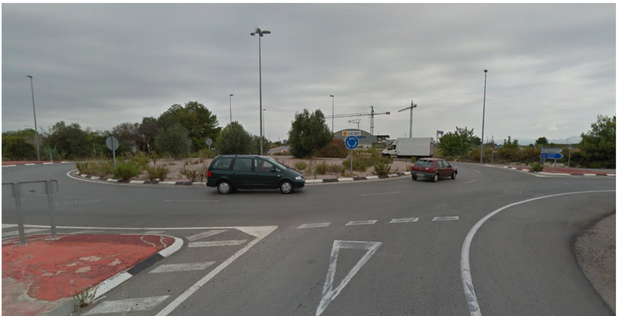
Punto de evacuación 2