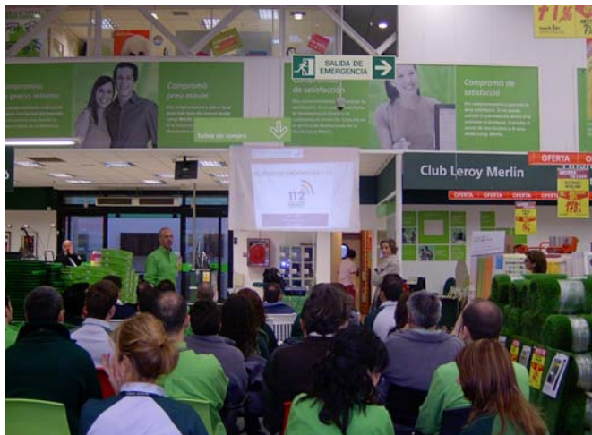
Els treballadors del Centre Comercial Leroy Merlin, a Massanassa, durant la ponència.

No obstant això, vam poder resoldre els dubtes que ens van plantejar i que estaven relacionades al tipus de telefonades que es reben en el telèfon d'emergències, al tractament que es realitza a les telefonades de broma, normalment protagonitzada per xiquets, i quina empresa o institució s'encarrega de gestionar el servei "112 Comunitat Valenciana".