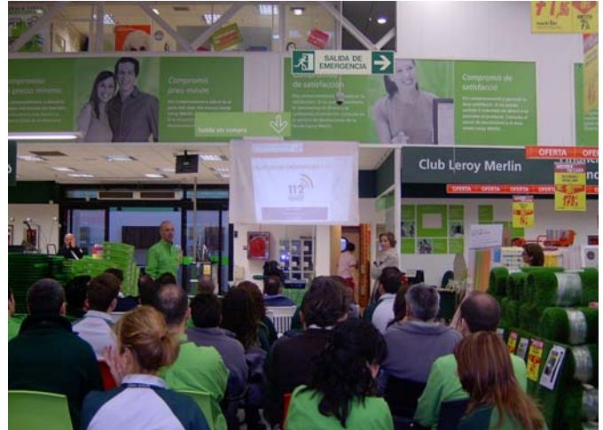
Los trabajadores del Centro Comercial Leroy Merlin, en Massanassa, durante la ponencia.

Sin embargo, pudimos resolver las dudas que nos plantearon y que estaban relacionadas al tipo de llamadas que se reciben en el teléfono de emergencias, al tratamiento que se realiza a las llamadas de broma, normalmente protagonizada por niños, y qué empresa o institución se encarga de gestionar el servicio "1-1-2 Comunitat Valenciana".