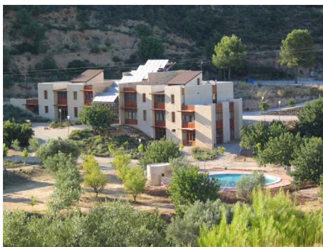
Centre de Turisme Rural que el Col·lectiu ACTIO té a Alborache

Amb els xiquets ja gaudint de les seues vacances escolars, les nostres xarrades comencen aquest mes de juliol a Alborache, a l'Alberg Rural Actio. Prop de 35 xiquets, que estan passant una setmana en aquest paratge rural, van poder assistir a una de les nostres primeres xarrades divulgatives de "1·1·2 Comunitat Valenciana", en el període estival.