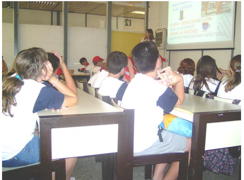
Els xics i xiques de l'Escola d'Estiu de la Universitat Politècnica de València, durant alguna de les xarrades.