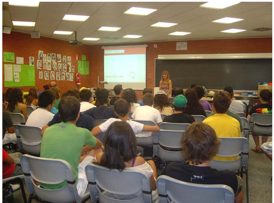
La xarrada es desenvolupa en l'Aulari Sur del Campus del Taroners, en la Universitat de València